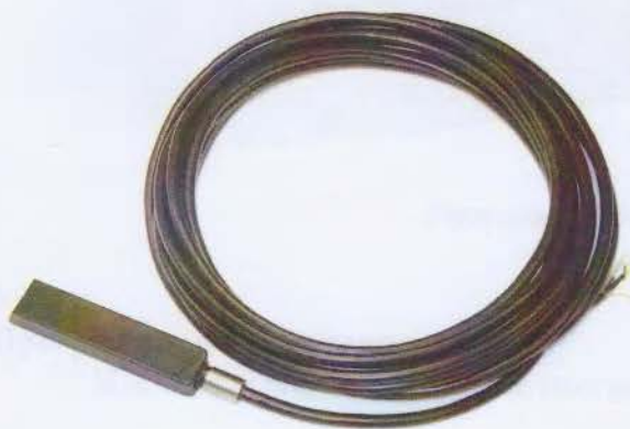
Рисунок 1 - Комбинированный датчик скорости и уровня, модель TIENet 350

Внешний вид датчиков (скорости и уровня) и электронного блока представлен на рисунках 1-5. Все модели датчиков скорости и уровня имеют неразъемный корпус, поэтому пломбирование не производится. Пломбирование электронного блока производится путем установки пломбы на замке крышки корпуса.