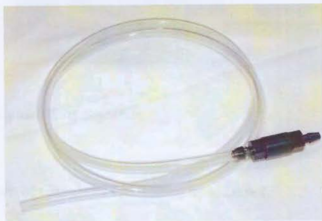
Рисунок 2 - Датчик уровня, модель TIENet 330