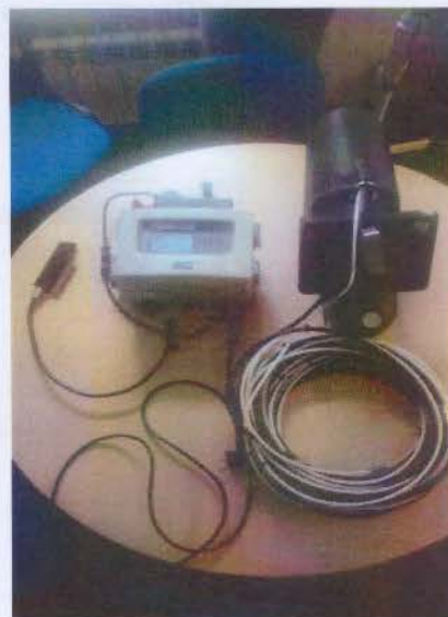
Рисунок 4 - Расходомер в сборе