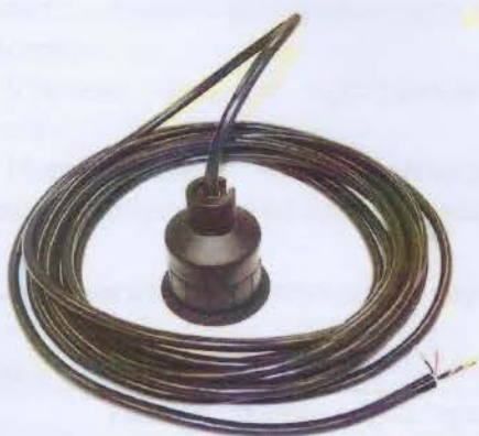
Рисунок 3 - Датчик уровня, модель TIENet 310